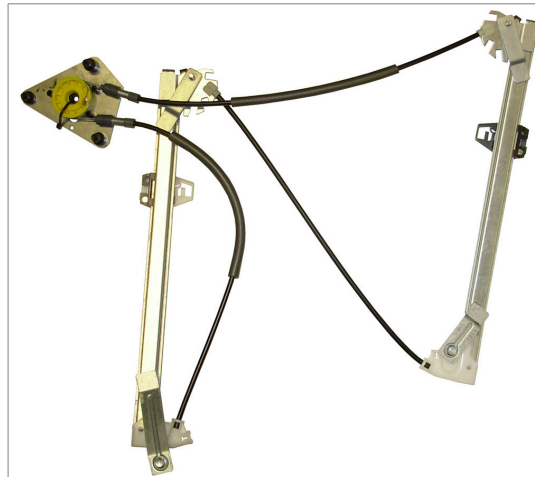
A POWER WINDOW RIGHT ALZACRISTALLI ELETTRICO DX

THIS INSTALLATION INSTRUCTION IS FOR BOTH LEFT AND RIGHT SIDE. CETTE INSTRUCTION DE MONTAGE EST POUR LES DEUX COTES DROIT ET GAUCHE. DIESE MONTAGE-ANLEITUNG IST FÜR DIE BEIDE LINKE UND RECHTE SEITE. ESTA INSTRUCCION DE MONTAJE ES PARA LOS DOS LADOS IZQUIERDO Y DERECHO. ESTAS INSTRUÇÕES VALEM TANTO PARA O LADO ESQUERDO QUANTO PARA O DIREITO. DEZE AANWIJZINGEN GELDEN VOOR ZOWEL DE LINKER- ALS DE RECHTERKANT. Η ΠΑΡΟΥΣΑ ΟΔΗΓΙΑ ΑΦΟΡΑ ΤΟΣΟ ΤΗΝ ΑΡΙΣΤΕΡΗ ΟΣΟ ΚΑΙ ΤΗ ΔΕΞΙΑ ΠΛΕΥΡΑ. LA PRESENTE ISTRUZIONE VALE SIA PER IL LATO SINISTRO CHE PER IL LATO DESTRO.