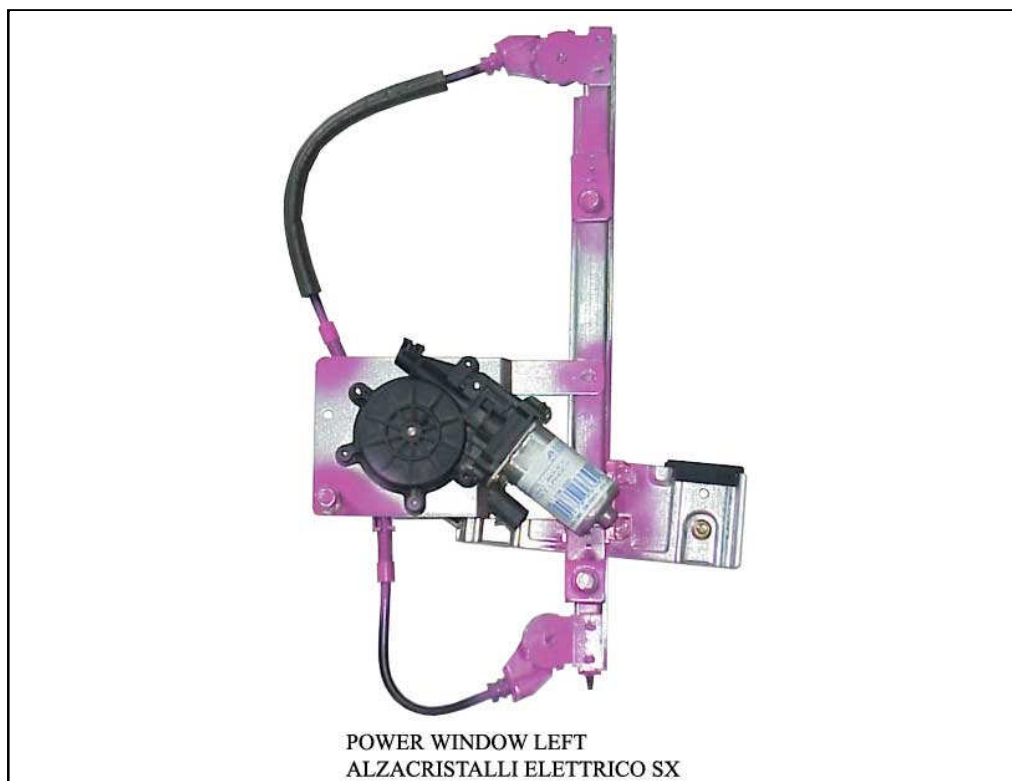
POWER WINDOW LEFT ALZACRISTALLI ELETRICO SX

THIS INSTALLATION INSTRUCTION IS FOR BOTH LEFT AND RIGHT SIDE. CETTE INSTRUCTION DE MONTAGE EST POUR LES DEUX COTES DROIT ET GAUCHE. DIESE MONTAGE-ANLEITUNG IST FÜR DIE BEIDE LINKE UND RECHTE SEITE. ESTA INSTRUCCION DE MONTAJE ES PARA LOS DOS LADOS IZQUIERDO Y DERECHO. LA PRESENTE ISTRUZIONE VALE SIA PER IL LATO SINISTRO CHE PER IL LATO DESTRO.