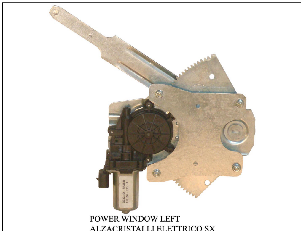
POWER WINDOW LEFT

LA PRESENTE ISTRUZIONE VALE SIA PER IL LATO SINISTRO CHE PER IL LATO DESTRO.